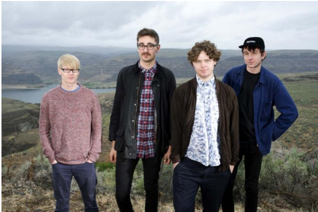
La B.O. du film a été composée par le groupe Alt-J