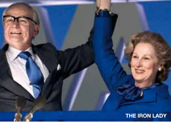
THE IRON LADY