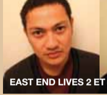
EAST END LIVES 2 ET EAST END LIVES 3