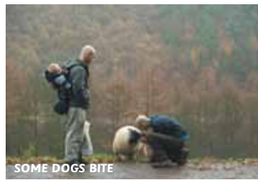
SOME DOGS BITE