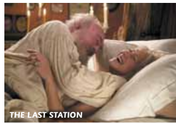
THE LAST STATION