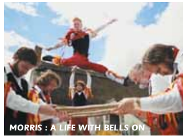
MORRIS : A LIFE WITH BELLS ON