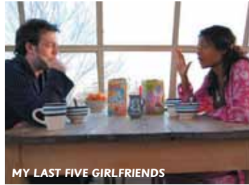
MY LAST FIVE GIRLFRIENDS